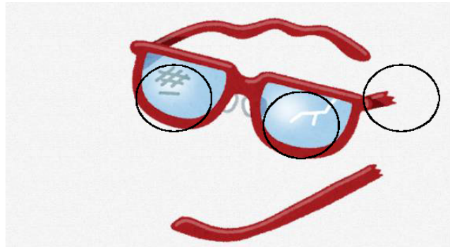
メガネのレンズに傷とフレーム破損