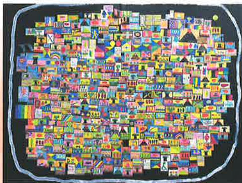
Beautiful world 荘司 久寿(秋田県)